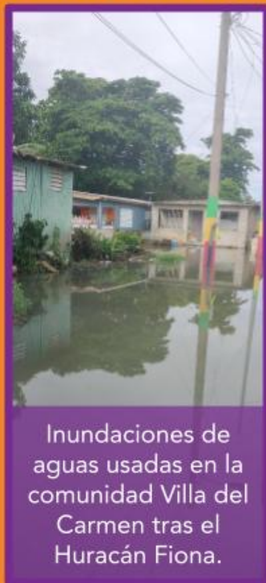
Inundaciones de aguas usadas en la comunidad Villa del Carmen tras el Huracán Fiona.